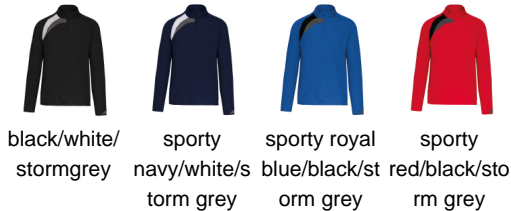
black/white/ stormgrey sporty navy/white/s portm grey sporty royal blue/black/st orm grey sporty red/black/sto rm grey